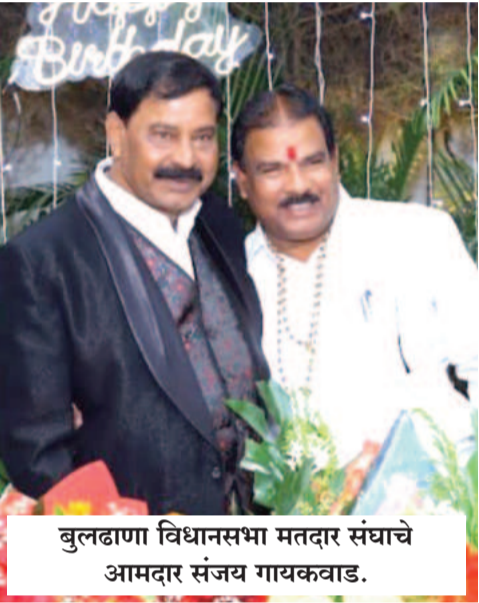
बुलढाणा विधानसभा मतदार संघाचे आमदार संजय गायकवाड.