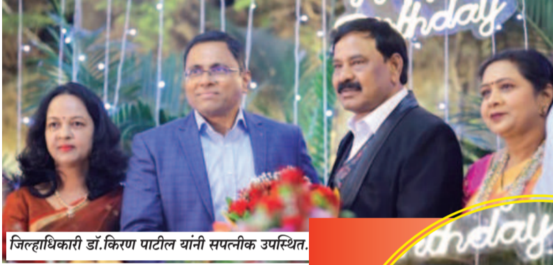
जिल्हाधिकारी डॉ.किरण पाटील यांनी सपलीक उपस्थित.